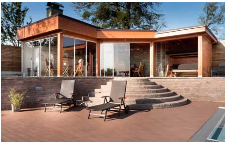
WoodPlastic®, prkna Premium Forest Plus Palisander

Výrobou atraktivních prken disponujících celou škálou přirozených barevných odstínů a na dotyk příjemných povrchů však služby zákazníkům nekončí. WPC – WoodPlastic disponuje celorepublikovou sítí terasových center a zkušených certifikovaných partnerů. Ti zájemcům, na rozdíl od většiny dovozců, terasu nejenom profesionálně nainstalují, ale ještě předtím vypracují její návrh, pomohou s výběrem povrchů a barev a kdykoli jim budou k dispozici cenými radami.