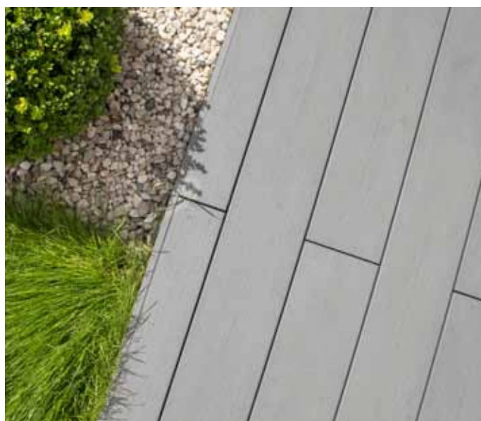
WoodPlastic®, prkna Max Forest Inox

na nich třísky ani štěpy. Snadno a rychle se montují bez nutnosti kotvení k pevnému podloží. Terasu není třeba natírat, olejovat ani impregnovat. Zcela postačí ji občas opláchnout proudem vody.