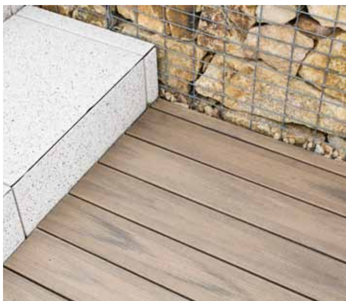
WoodPlastic®, prkna Premium Forest Plus Teak