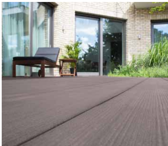
WoodPlastic®, prkna Max Forest Wenge