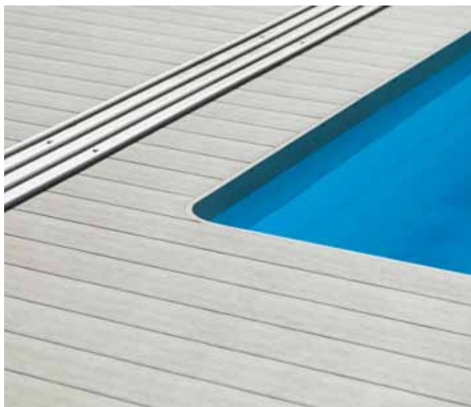
WoodPlastic®, prkna Top Rustic Inox